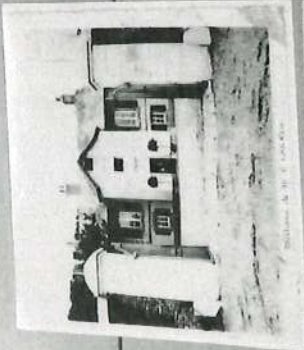
Compadre de Harau

Le château fut dévasté lors de la seconde guerre mondiale par les bombardements anglais.